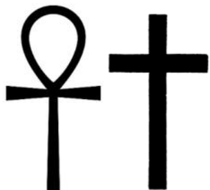
CRUZ ANSADA CRUZ LATINA

Desde que el hombre fue expulsado del Edén y perdió la comunión con su Creador, ha optado por seguir sus propios pensamientos y ha imaginado poder establecer contacto con aquello que a su modo de entender es lo sobrenatural y que puede alcanzar y gozar de sus beneficios. De esa manera ha imaginado compensar la irreparable pérdida a que él mismo se expuso en Edén y ha ideando cosas a las cuales, después de haber imaginado, les da forma y les rinde culto.