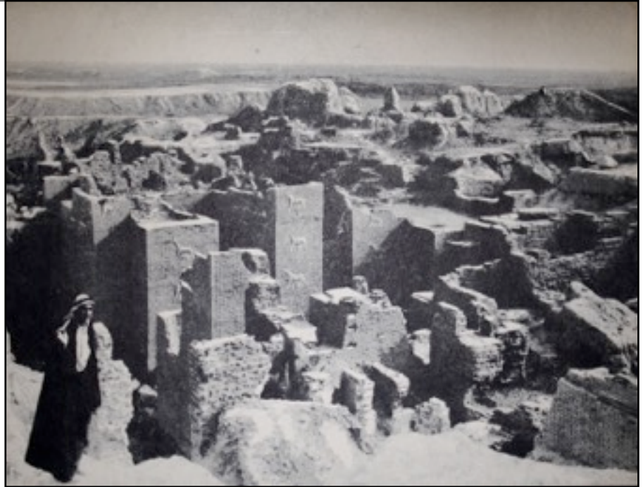
Vista parcial de las ruinas de Babilonia, en Iraq

Dos propósitos tuvieron aquellos descendientes de Noé, el primero está declarado; pero el segundo no lo está pues no dice cuál fue el propósito exacto. Debido a eso, la versión de la Biblia de Martín Nieto interpreta el