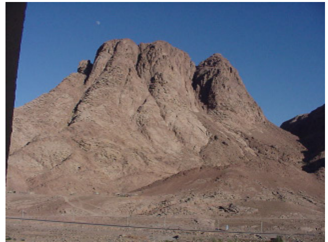
Vista parcial del monte Sinaí tradicional ubicado en la península del Sinaí, Egipto.

Si alguna vez alguien intentó corroborar el relato del Éxodo buscando evidencias de la destrucción del ejército de Fa-