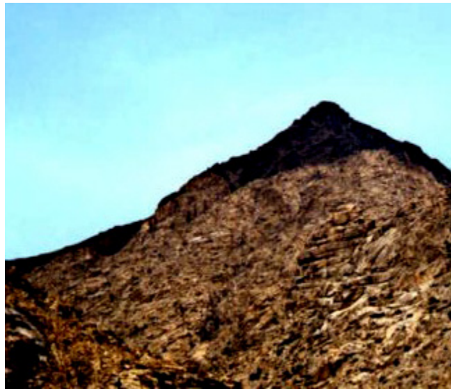
El pico de Jabal al-Lawz y parte de su falda están quemados

Sin embargo, en los últimos tiempos Jabal al-Lawz ha empezado a despertar el interés de personas es-